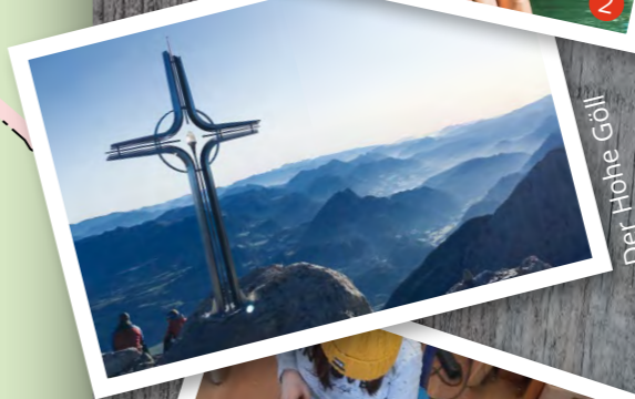
Der Hohe Göll

PARKEN IN KUCHL P1 Gemeindezentrum P2 Severinplatz (zwischen Museum und Kirche) P3 Untermarkt (neben Hotel Wagnernigl) P4 Seeparkplatz: Gebührengel. | Busparkplatz vorh. € 0,70/30 Min. | € 7,00 Tagespfl. 1.5. - 30.9. P5 Mittelschule: Freies Parken | Busparkplatz vorh. Kurzparkzone von 1.7. - 31.8. | 8:00 - 18:00 Uhr P6 Park & Ride: Bhf Kuchl | Nur für Bahnbenützung P7 + E Kindergarten: 2 E-Parkplätze mit Ladestation